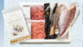
凍眠市場 お刺身用詰合せ

凍眠市場 真鯛とぶりのりゅうきょう漬けセット 賞状付 冷蔵 5,000円 税込5,400円 真鯛りゅうきょう漬け70g×4、 ぶりりゅうきょう漬け70g×4、わさび2.5g×8