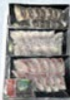
凍眠市場 新鮮なたさぎセット

賞状付 冷蔵 5,000円 税込5,400円 炙りかつお約200g、お刺身かつお約200g、 かつおハラス約300g、かつお切り身約150g×各1