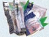
凍眠市場 気仙沼元産 かつお三昧詰合せ

賞状付 冷蔵 5,000円 税込5,400円 タイ、アジ、タチウオ、サバ、イシモチ ×各1パック