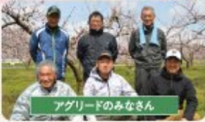
アグリードのみなさん