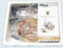
凍眠市場 ソフト干物詰合せ

賞状付 冷蔵 5,000円 税込5,400円 まぐろ刺身約160g×1パック、まぐろたたき約160g×1パック、 炙りかつお約200g×1、真鯛フィレ約150g×1