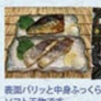
凍眠市場 気仙沼元産 特選干物

賞状付 冷蔵 5,000円 税込5,400円 炙りかつお約200g、炙りまぐろ約300g、 炙りびんちょう約200g