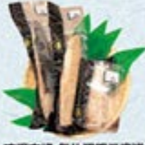
凍眠市場 気仙沼元産 炙り三昧詰合せ

賞状付 冷蔵 5,000円 税込5,400円 真鯛タタキ120g、かんばちタタキ120g、 メバチタタキ120g、ボン酢もみじ×3