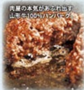
肉質の本気があふれ出す 山形牛100%ハンバーグ